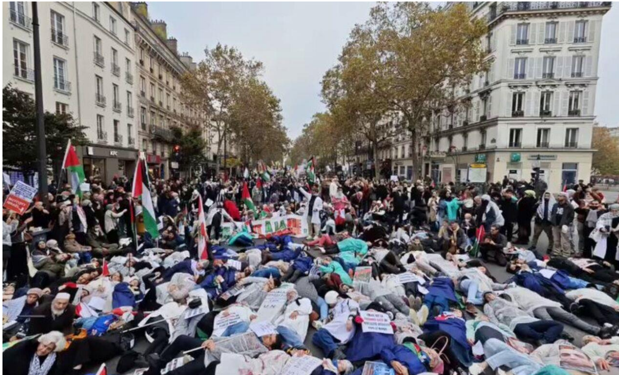
تصویر ۱. کارگران درمان فرانسه برای حمایت از فلسطینیان در نوار غزه به خیابان‌های پاریس آمدند.

در ژوئیه ۲۰۲۴ کارکنان درمان دوبلین در ایرلند در مقابل سفارت آمریکا علیه حمایت‌های این کشور از اسرائیل اعتراض کردند. در طول تظاهرات پلیس برای پایان دادن به آن وارد عمل شد و تعداد زیادی از تظاهرات‌کنندگان دستگیر شدند.