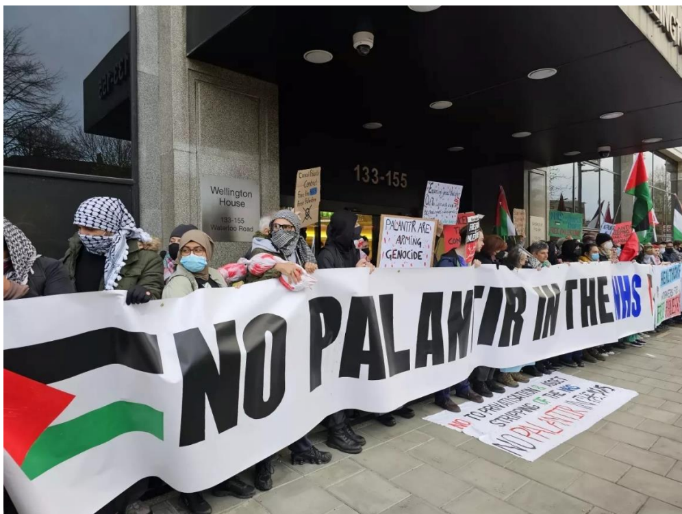
تصویر ۸. صدها کارکن بخش درمان بریتانیا دفتر مرکزی غول فناوری آمریکایی Palantir در لندن را تعطیل کردند تا تجارت آن را مختل کنند.