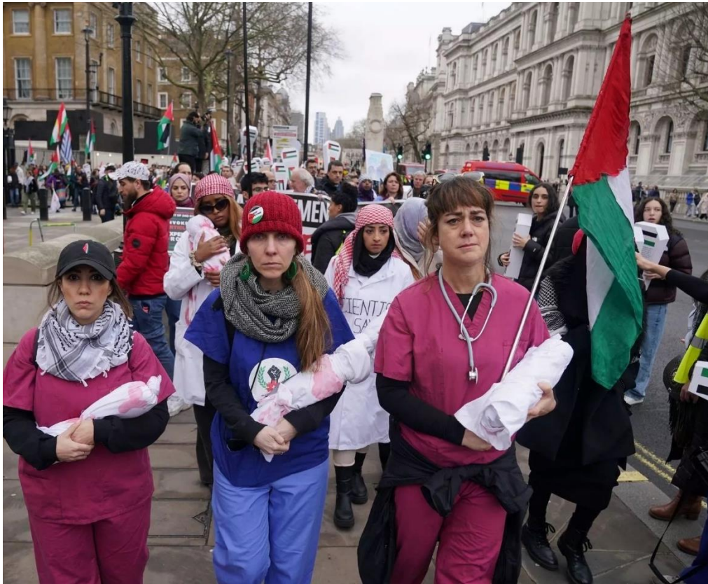
تصویر ۱۱. کارکنان بخش درمان در لندن به نشانه‌ی اعتراض با لباس‌های فرم و اجساد غیرواقعی کودکان به خیابان‌ها آمدند.