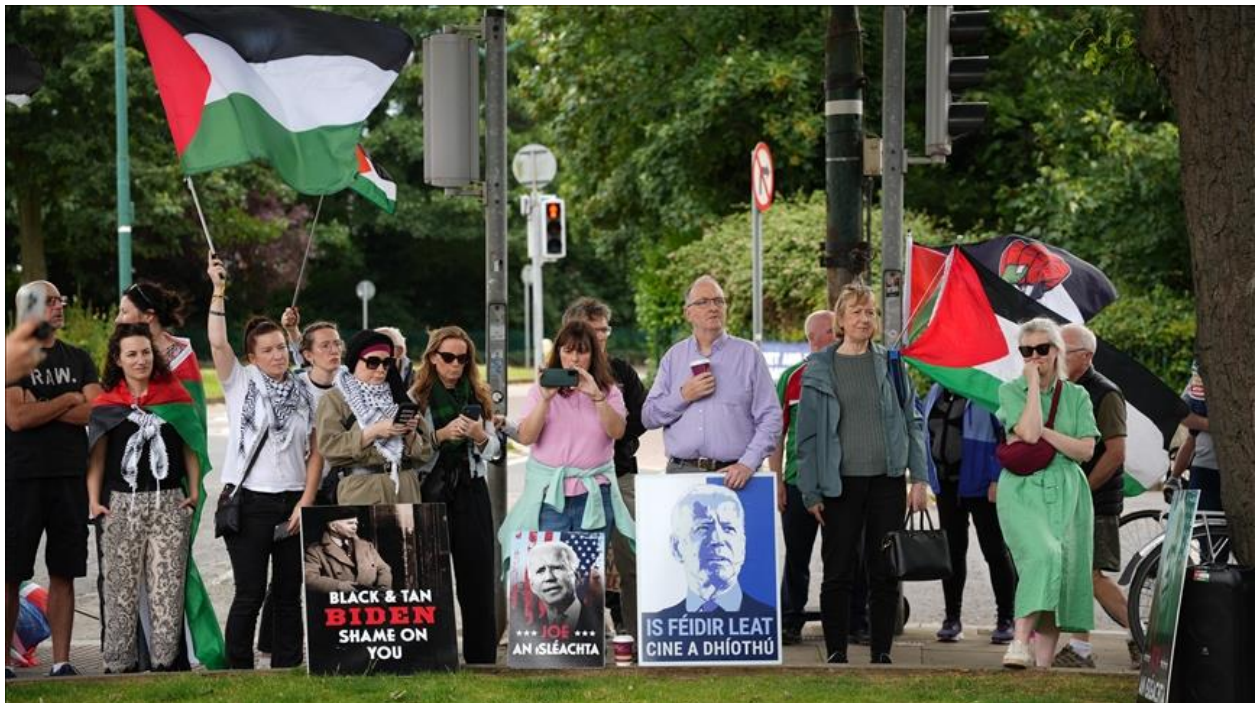
تصویر ۳. تظاهرات کارگران درمان دوبلین در دفاع از فلسطین.