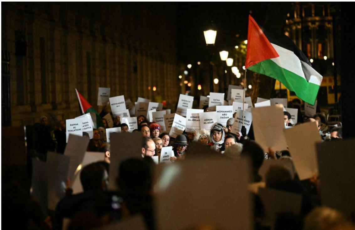
تصویر ۱۲. پرچم‌های فلسطین در حالی به اهتزاز درمی‌آیند که کارگران درمان بریتانیا با پلاکاردهایی برای سوگواری نیروهای درمانی کشته‌شده در غزه در دروازه‌های داونینگ استریت، محل اقامت رسمی نخست‌وزیر بریتانیا در مرکز لندن، جمع شده و خواهان آتش‌بس هستند.