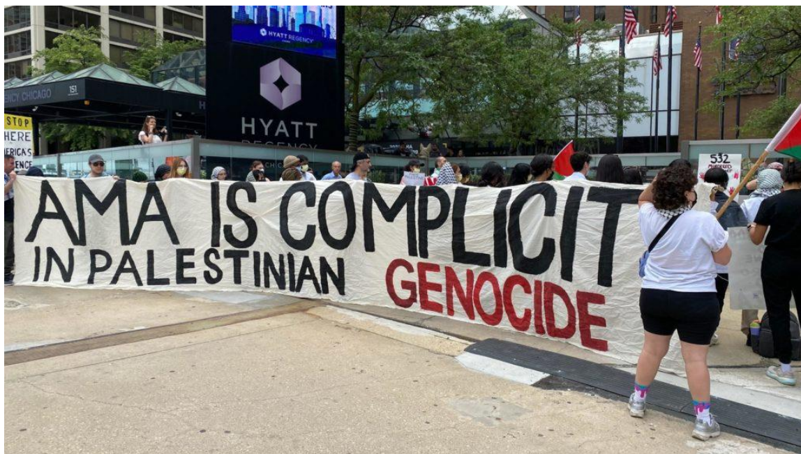
تصویر ۵. کارکنان بخش درمان ایالات متحده در نشست اخیر انجمن پزشکی آمریکا اعتراض کردند و سکوت این انجمن در قبال نسل‌کشی در فلسطین را محکوم کردند. این معترضان در مقابل ساختمان AMA تجمع کردند.

کارگران بخش درمان در سراسر آمریکا تحت شرایط معیشتی سختی کار می‌کنند. همچنین بیش از ۳۰ میلیون شهروند آمریکایی از داشتن بیمه‌ی درمانی محروم‌اند. این در حالی است که دولت امریالیستی آمریکا میلیاردها دلار بودجه را برای بمب و گلوله هزینه می‌کند. "مردم نمی‌توانند انسولین خود را بخرند اما همیشه برای بمب پول وجود دارد."