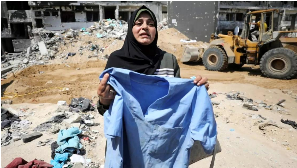
تصویر ۰۱ زنی که اسکراب پزشکان را نگه می‌دارد، در حالی که امدادگران در جستجوی اجساد در داخل بیمارستان الشفاء غزه پس از تخریب نیروهای اسرائیلی هستند. (۸ آوریل ۲۰۲۴)