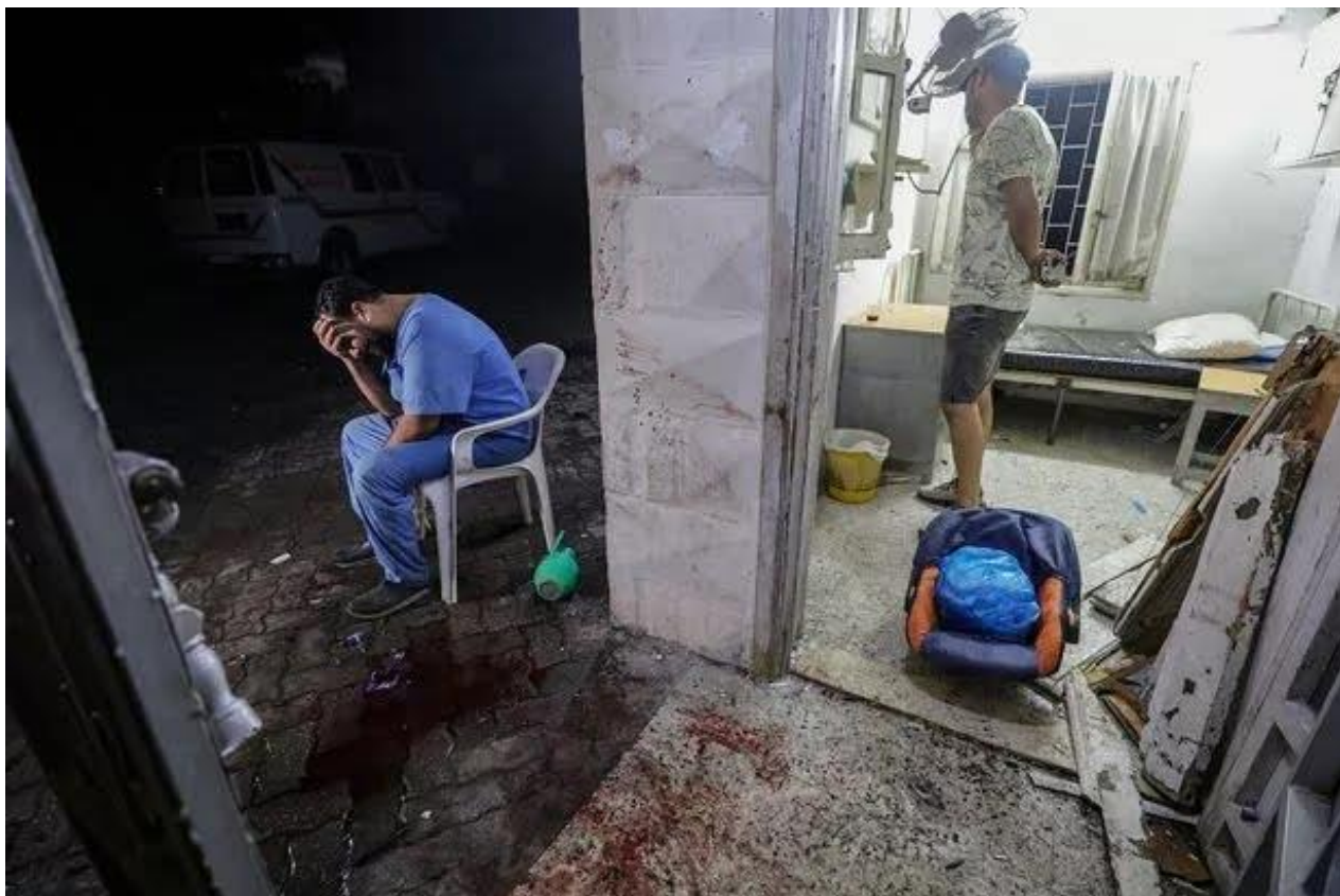
تصویر ۲. پزشکی فلسطینی بعد از حمله‌ی هوایی اسرائیل به بیمارستان الاهلی در غزه.