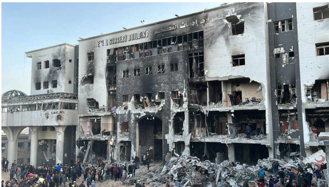
تصویر ۱۲. بیمارستان الشفاء پس از یک محاصره‌ی دو هفته‌ای اسرائیل.