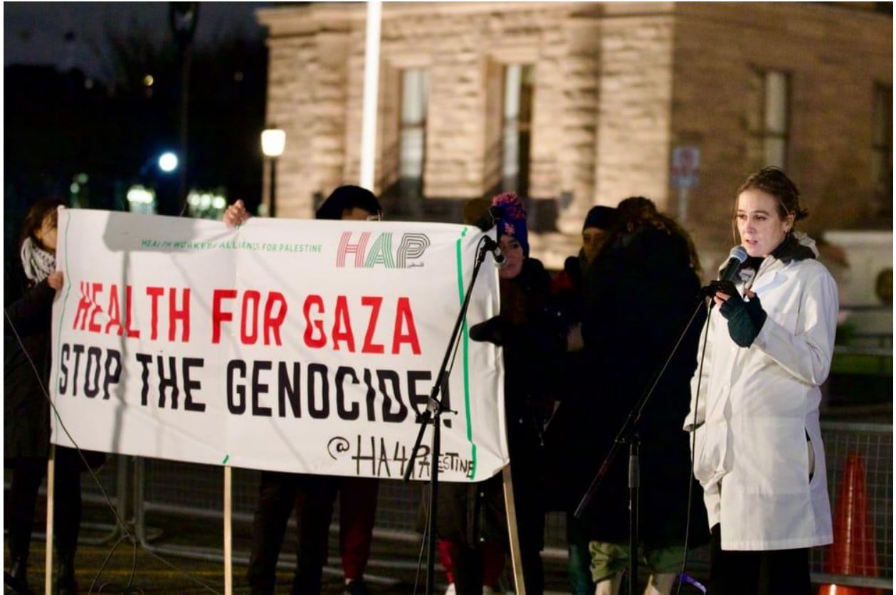
تصویر ۲. تجمع کارگران درمان در کانادا برای دفاع از فلسطین.