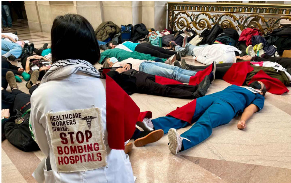
تصویر ۲. کارکنان بخش درمان در سانفرانسیسکو در اعتراض به بمباران بیمارستان‌ها در غزه در تالار آن شهر تجمع کردند.

آن را خرج تسلیحات نظامی برای کمک به اسرائیل می‌کند... من به کارگرانی که در این همبستگی گرد هم می‌آیند تا توسط آن قدرتی را که داریم نشان دهند افتخار می‌کنم. من فکر می‌کنم به آن نیاز بیشتری داریم."