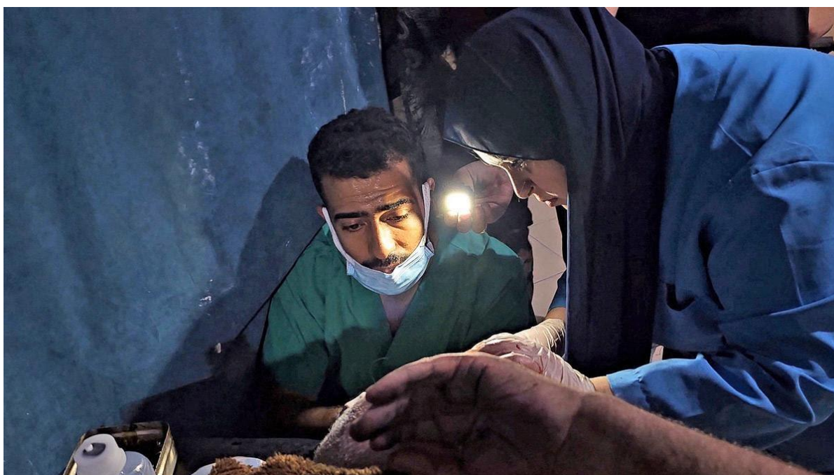
تصویر ۱۴. نیروهای درمانی با استفاده از چراغ قوه به دلیل کمبود برق در بیمارستانی در شمال نوار غزه یک فلسطینی مجروح را درمان می کنند.