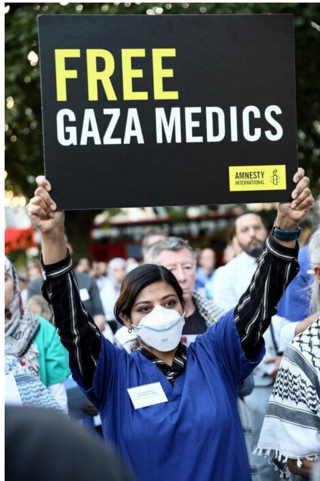
تصویر ۱ تا ۷. ده‌ها تن از کارکنان بخش درمان بریتانیا در اعتراض به بازداشت همکاران فلسطینی خود در غزه و همچنین در حمایت از مبارزه برای آزادی فلسطین تجمع کردند.