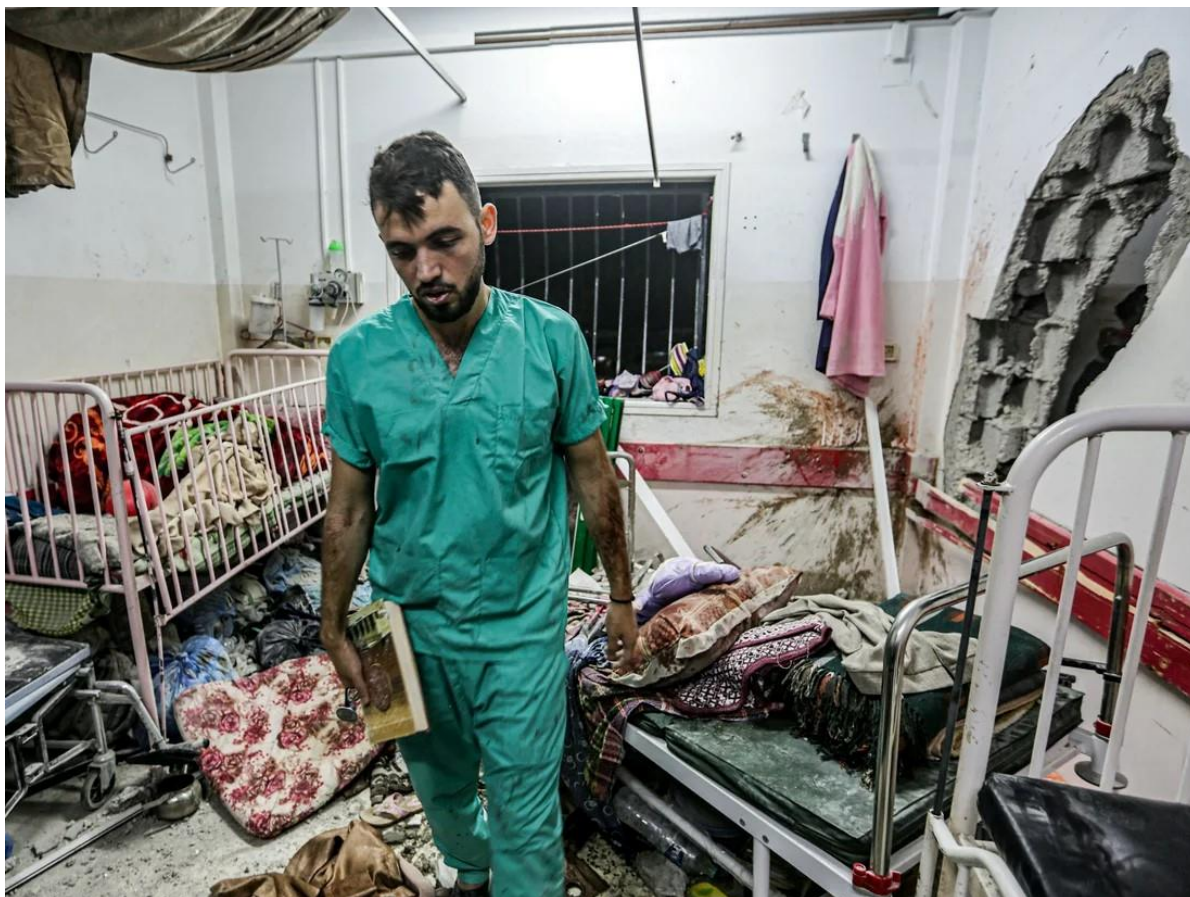
تصویر ۱۳. بمباران بیمارستان ناصر در خان یونس در جنوب نوار غزه.