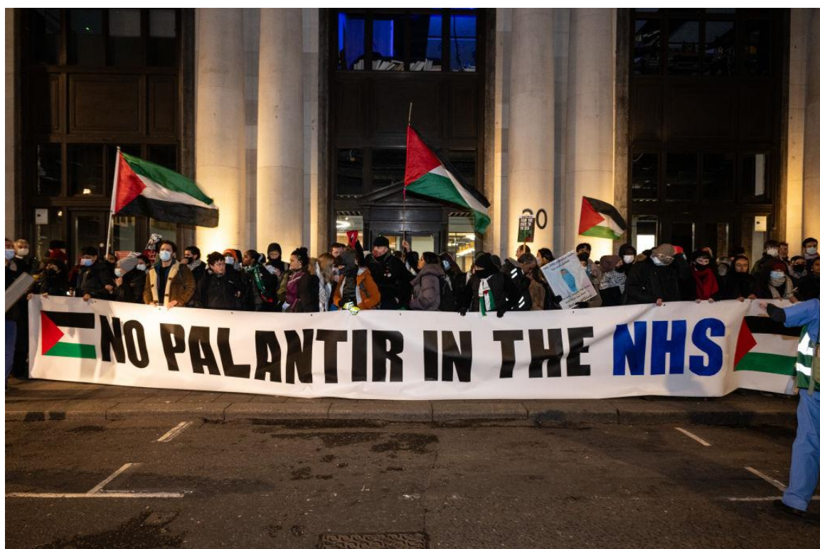
تصویر ۹ و ۱۰. کارگران درمان در لندن علیه قرارداد NHS با Palantir مقابل ساختمان NHS تجمع کردند.