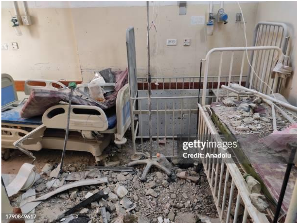
تصویر ۷. بیمارستان کمال عدوان پس از هدف قرار دادن ارتش اسرائیل در بیت لاهیا در غزه.