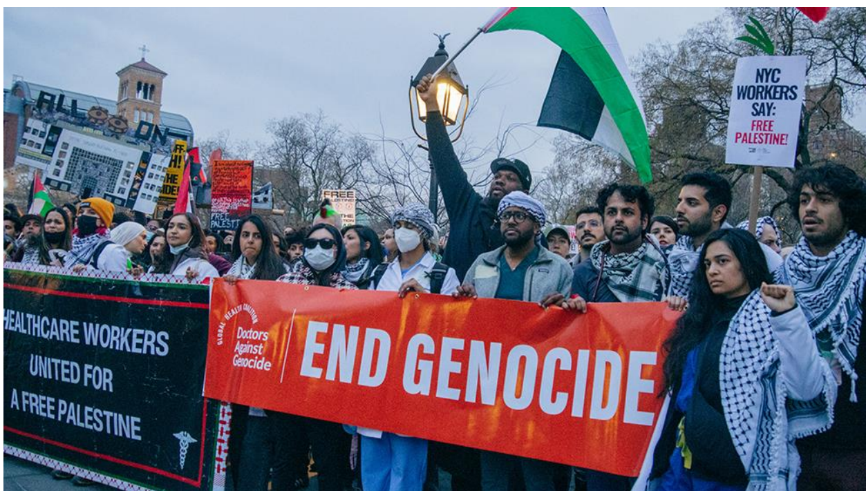
تصویر ۶ و ۷. کارکنان بخش درمان ایالات متحده در شیکاگو و در خارج از جلسه‌ی مجلس نمایندگان انجمن پزشکی آمریکا تظاهراتی برپا کردند.