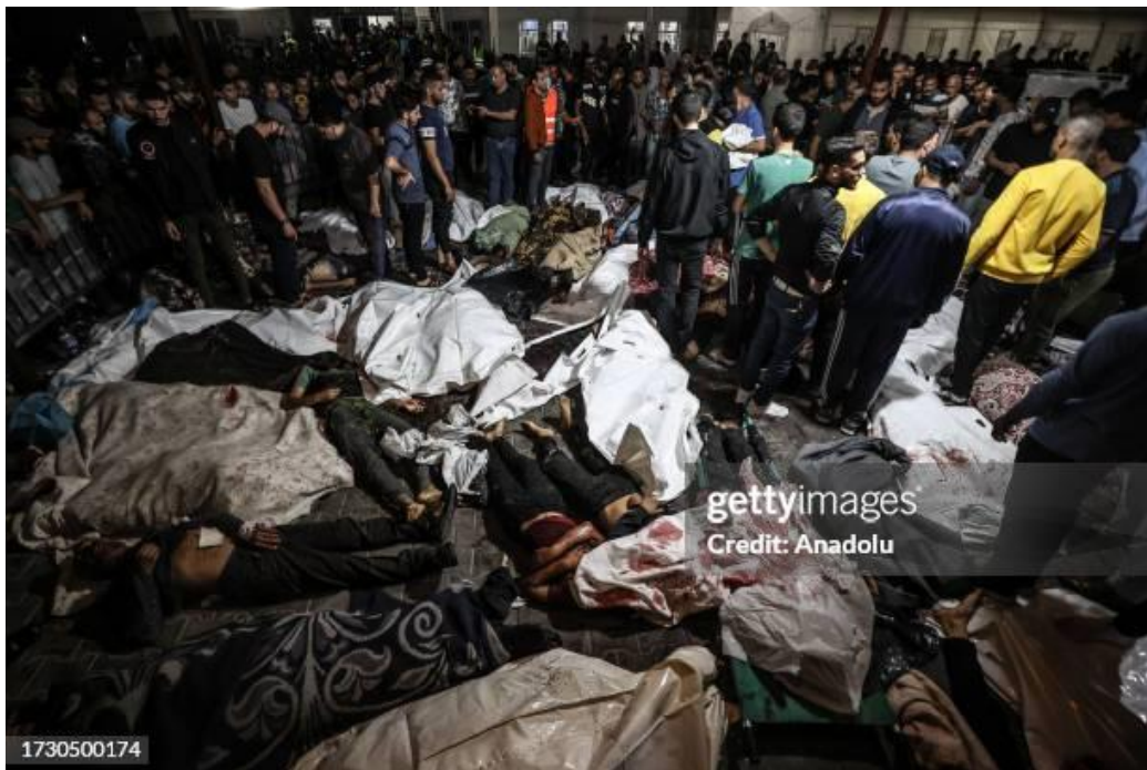
تصویر ۸. بیش از ۵۰۰ نفر در انفجاری در بیمارستان باپتیست الاهلی غزه در ۱۷ اکتبر ۲۰۲۳ کشته شدند.