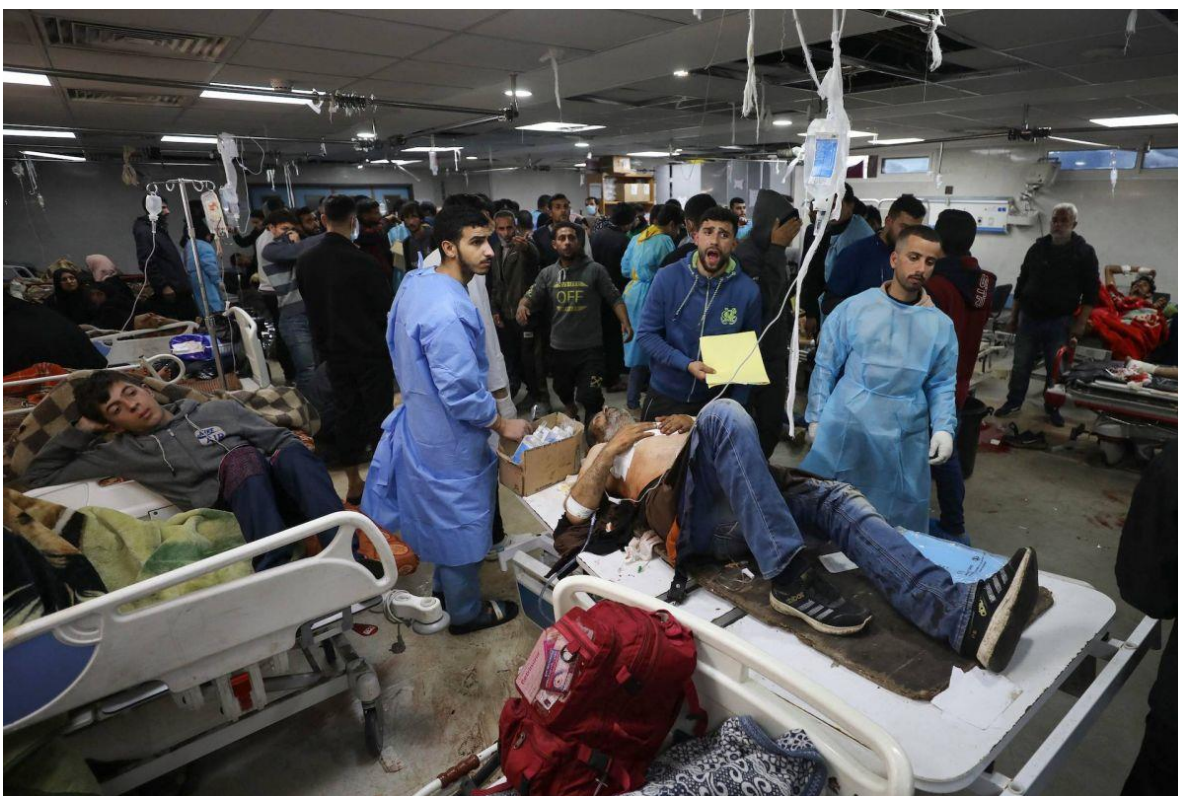
تصویر ۴ و ۵. وضعیت بیمارستان الشفاء بعد از حمله‌ی اسرائیل به شهر غزه در ۲۵ ژانویه‌ی ۲۰۲۴ که دستکم ۲۰ کشته و بیش از ۱۵۰ زخمی برجا گذاشت.