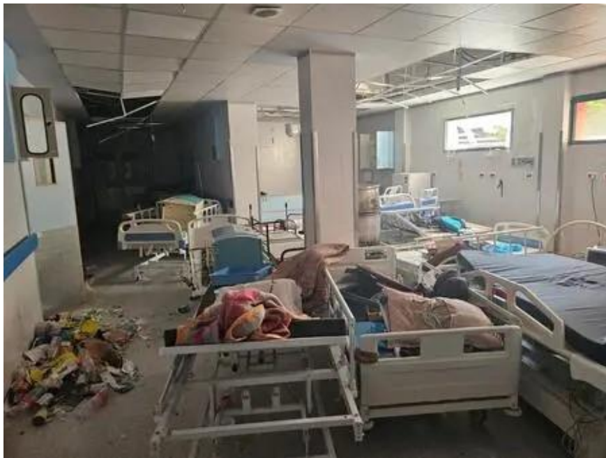
تصویر ۹. عکس گرفته شده از داخل بیمارستان ناصر.