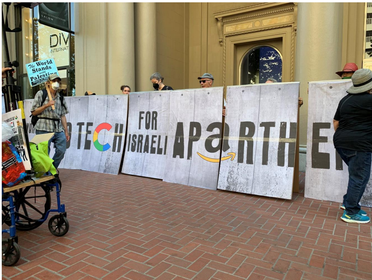
تجمع اعتراضی کارکنان گوگل و آمازون

آزادی فلسطین به پا خیزیم. آمازون و گوگل که این قرارداد را امضا کرده‌اند هنوز هم می‌توانند انتخاب کنند که در سمت درست تاریخ بایستند. ۱۰