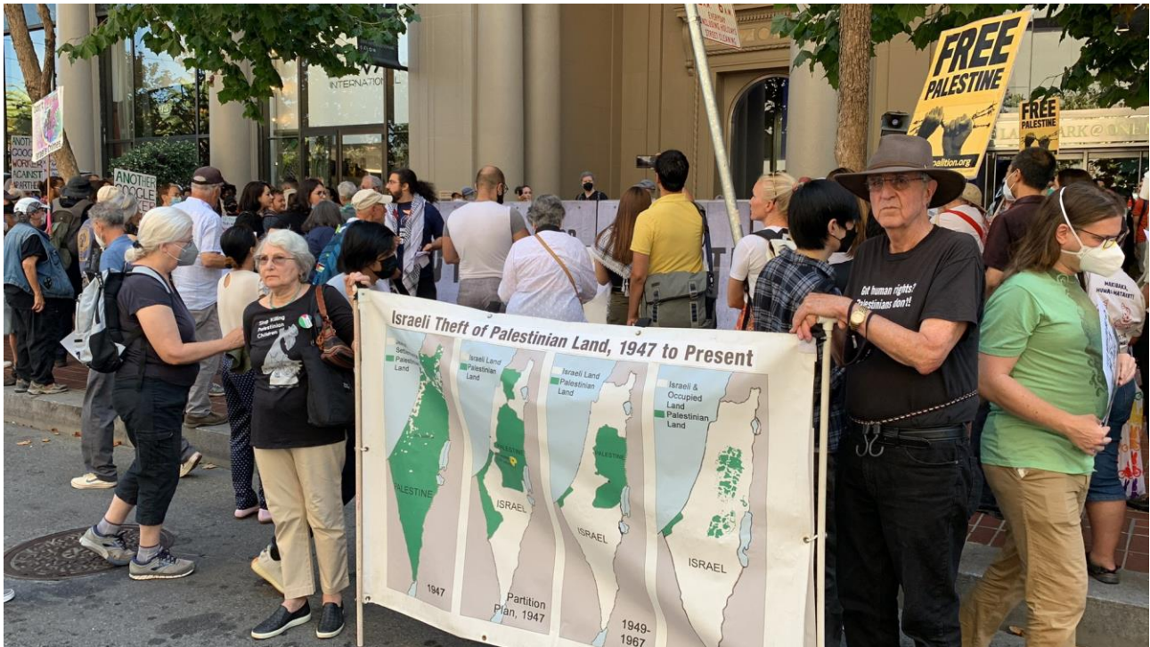
تجمع اعتراضی کارکنان گوگل و آمازون، نقشه‌ای که معترضان در دست دارند پیشروی اشغالگری اسرائیل از سال ۱۹۴۷ تا کنون را نمایش می‌دهد

اتحادیه‌ی کارگران فروشگاه‌های زنجیره‌ای قهوه‌ی استارباکس نیز با انتشار بیانیه‌ای از فلسطین حمایت کردند و اعلام کردند که در کنار فلسطین می‌ایستند: "ما مخالف خشونت در فلسطین و اسلام‌هراسی هستیم. اتحادیه‌ی ما شامل کارگران یهودی، فلسطینی و مسلمان می‌شود و یهودیانی که مخالف سیاست‌های اسرائیل هستند نیز از ما حمایت می‌کنند، همین نشان می‌دهد که اتحاد ما برای آزادی فلسطین چقدر ضروری است. ما اشغال، کوچ اجباری، خشونت دولتی، آپارتاید و تهدید به نسل‌کشی در فلسطین را محکوم می‌کنیم. ما همچنین استارباکس را برای استفاده‌ی بی‌شمارانه از چنین بحران انسانی‌ای برای دروغ‌پردازی علیه اتحادیه‌ی ما و تهدید ما محکوم می‌کنیم. ... ما از سایر اتحادیه‌های کارگری می‌خواهیم به اتحاد کارگران استارباکس بپیوندند و از ما حمایت کنند."