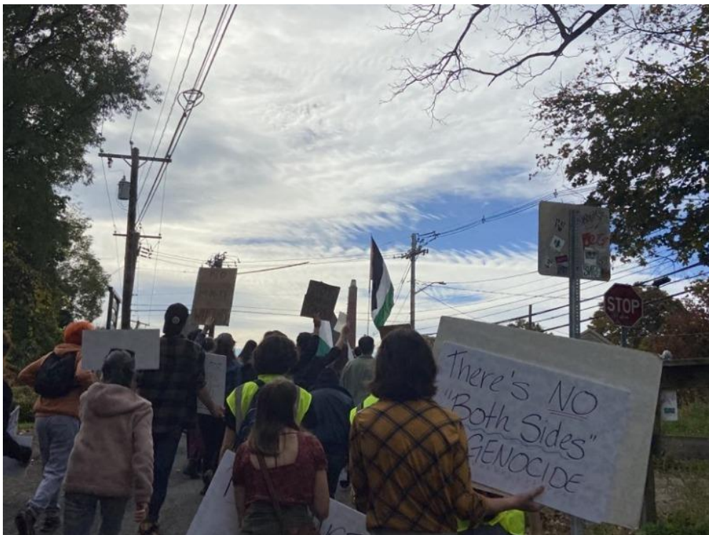
تجمع در بیرون محوطه‌ی کارخانه‌ی اسلحه‌سازی L3 Harris

کارگران کارخانه‌ی اسلحه سازی L3 Harris که نهمین تولیدکننده‌ی اسلحه در جهان است، نیز با اعلام اینکه مانع صدور اسلحه به اسرائیل خواهیم شد، دست از کار کشیدند. این کارگران بعد از تجمع فعالان حامی فلسطین در اطراف کارخانه و سردادن شعار "کارت رو رها کن" توسط معترضان خطاب به کارگران، دست از کار کشیدند. این فعالان اعلام کردند که ما حاضر نیستیم حتی یک پنی از منابع مالی ما صرف نسل‌کشی در غزه شود.